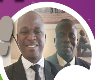
DS. LOKI EN DS. FALAMENGA

N.A.V. DE ROEPING EN UITZENDING VAN DE DISCIPELEN